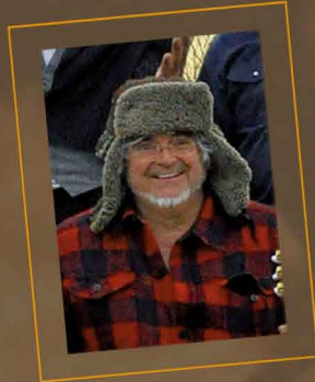
André de Larachunedent

Au centre culturel le Brin de Vie à 20h00